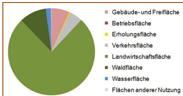
Flächennutzung im Nördlichen Osnabrücker Land (tatsächliche Nutzung, 01.01.2005)

Quelle: Niedersächsische Landesamt für Statistik / Online Regionaldatenbank